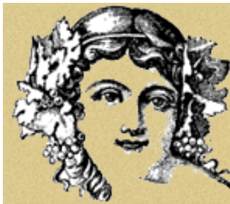
Dea del vino