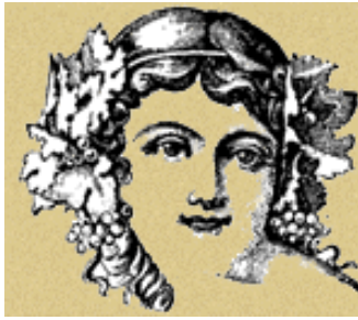
Dea del vino