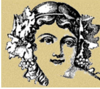
Dea del vino