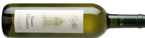
Soave DOC Classico 2011