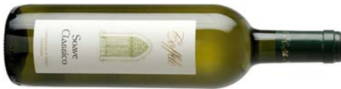
Soave DOC Classico 2011