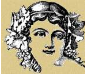
Dea del vino